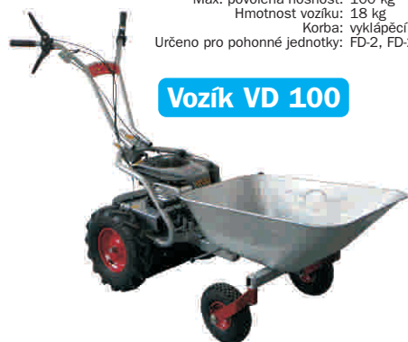
Vozík VD 100

Max. povolená nosnost: 100 kg Hmotnost vozíku: 18 kg Korba: vyklápěcí se zajištěním Určeno pro pohonné jednotky: FD-2, FD-2H, FD-3, Panter RZS