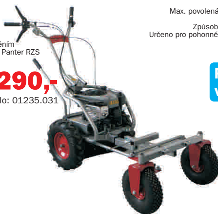
Podvozek říditelného vozíku KOR 220

Max. povolená nosnost: 220 kg Korba: odnímatelná, vyklápěcí se zajištěním Způsob zatáčení: řízená kola Určeno pro pohonné jednotky: FD-2, FD-2H, FD-3, Panter RZS