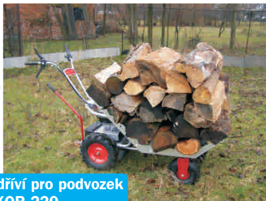
Korba na metrové dříví pro podvozek říditelného vozíku KOR 220