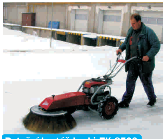
Rotační kartáč Laski ZK 8500

Max. šířka záběru: 90 cm Materiál štětín: polypropylen nebo polypropylen + ocel Směr otáček kartáče: pravotočivý Určeno pro pohonné jednotky: FD-2, FD-2H, FD-3, Panter RZS