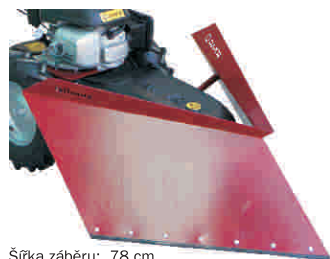
Šířka záběru: 78 cm

Max. výkon: 1925 m 2 /hod Max. šířka záběru: 55 cm Výška strniště: nastavitelná 2 - 10 cm Materiál skříňové mulčovače: nerezová ocel Hmotnost: 10 kg