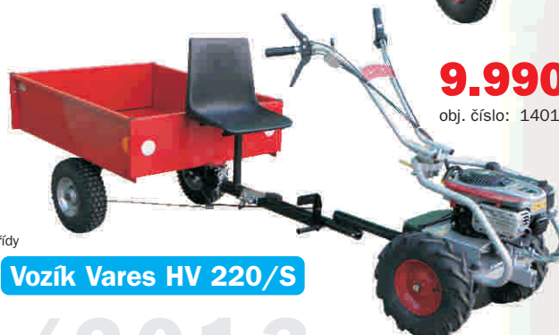
Vozík Vares HV 220/S

Max. povolená nosnost: 220 kg Korba: odnímatelné čelo, vyklápěcí se zajištěním Na vyžádání s dokumentací pro provoz na silnicích III. třídy Parkovací I provozní brzda Způsob zatáčení: řízená kola Určeno pro pohonné jednotky: FD-2, FD-2H, FD-3, Panter RZS